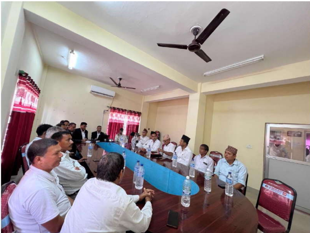
कार्यक्रमका सहभागीहरु ।