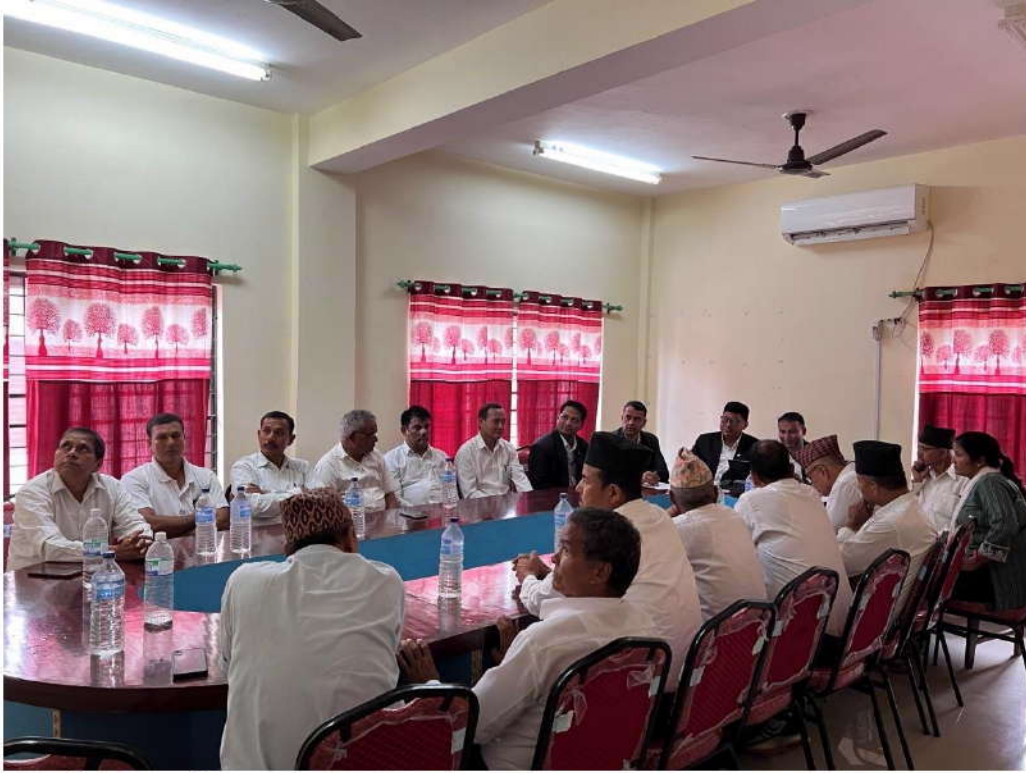
अन्तरक्रिया कार्यक्रमका सहभागीहरु ।